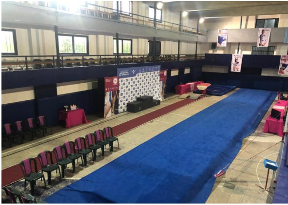
PARA LA PREMIACIÓN