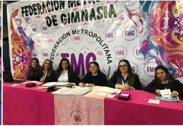
EL GIMNASIO AUXILIAR